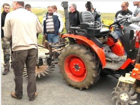
Journée technique au domaine de La Pinte à Arbois sur les outils de travail du sol. Présentation de l'étoile de binage construite avec l'Atelier Paysan et les doubles disques Braun montés entre roues.