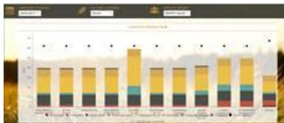
Captures d'écran de l'outil « Bio-partage » utilisé pour le groupe DEPHY

Pour plus d'information, contactez Alice Dousse : alice.dousse@agribiofranche.comte.fr