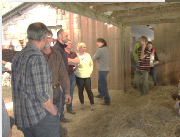
Une quinzaine de participants en visite à la ferme Würgler

Journée sur l'autonomie et visite de ferme GAEC Würgler dans le Territoire de Belfort mardi 28 mars. Une exploitation 100% herbe et avec une alimentation foin/regain qui a des résultats économiques intéressants. Visite ayant permis d'échanger sur un choix d'autonomie.