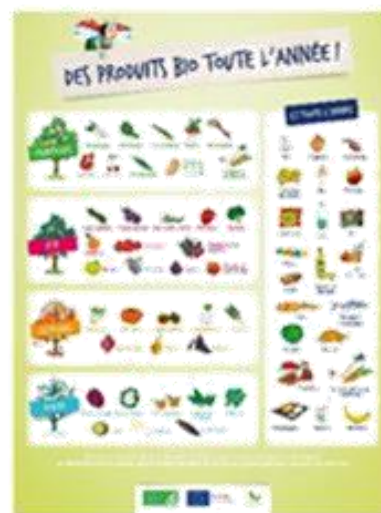
« Saisonnalité »

Les événements de la campagne sont également renseignés sur le site La Bio des 4 saisons (dupliquée par l'appli La bio en Poche )... pour une meilleure visibilité des animations sur le territoire !