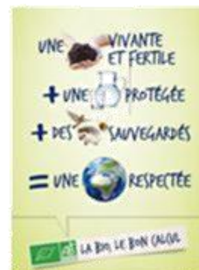
« Environnement »